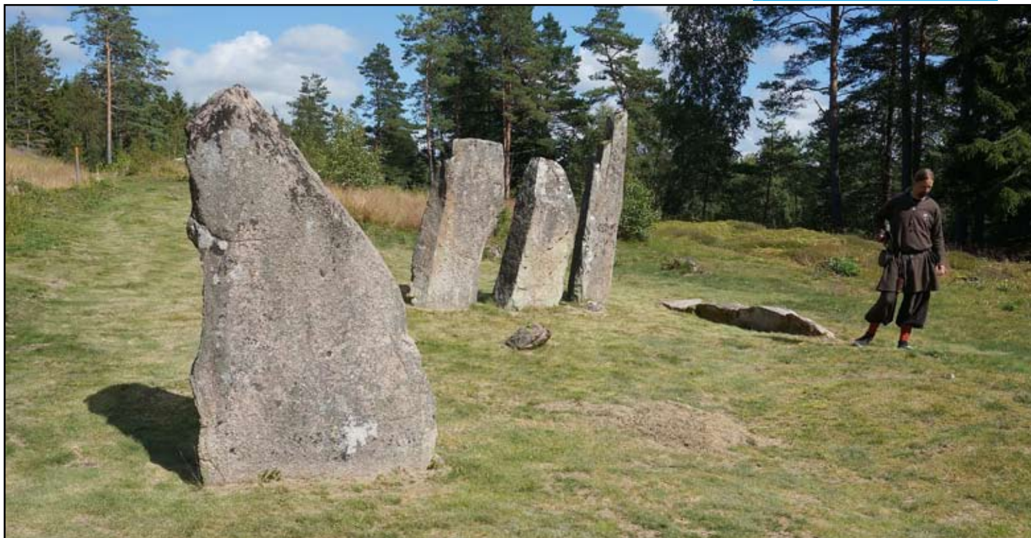
STENRAD. Den här typen av resta stenar i rad är mycket ovanliga. Men det finns flera liknande inom några mil från Vrångstad.

Publicerad i september 2017. Ansvarig utgivare: Mikael Jägerbrand. Författare: Mikael Jägerbrand Mer info: www.fornguiden.se